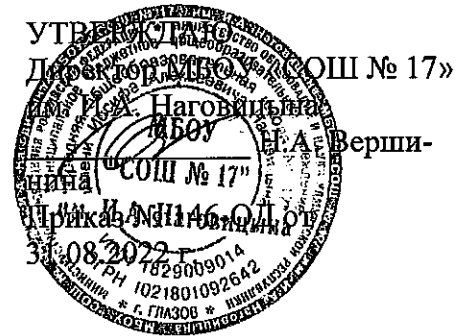
График линеек 1 сентября 2023